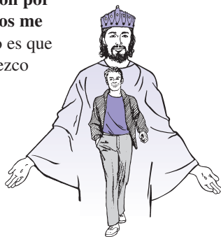
Dios me ve en Cristo.

Cristo vive en mí, y si yo realmente lo amo, no voy a querer continuar pecando. En lugar de perder la calma cuando haya cosas que me molestan, debería pedirle a Jesús que arregle las cosas por mí. ¡A Él le gusta hacerlo!